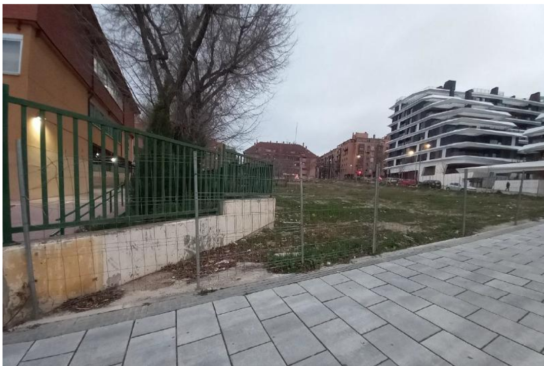
Calle del Duque de Tovar