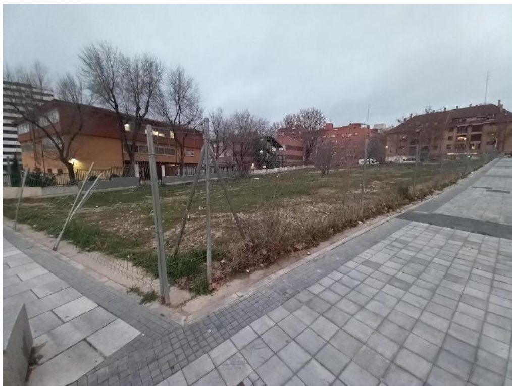
Esquina sur de la Calle Alejandro Dumas 17