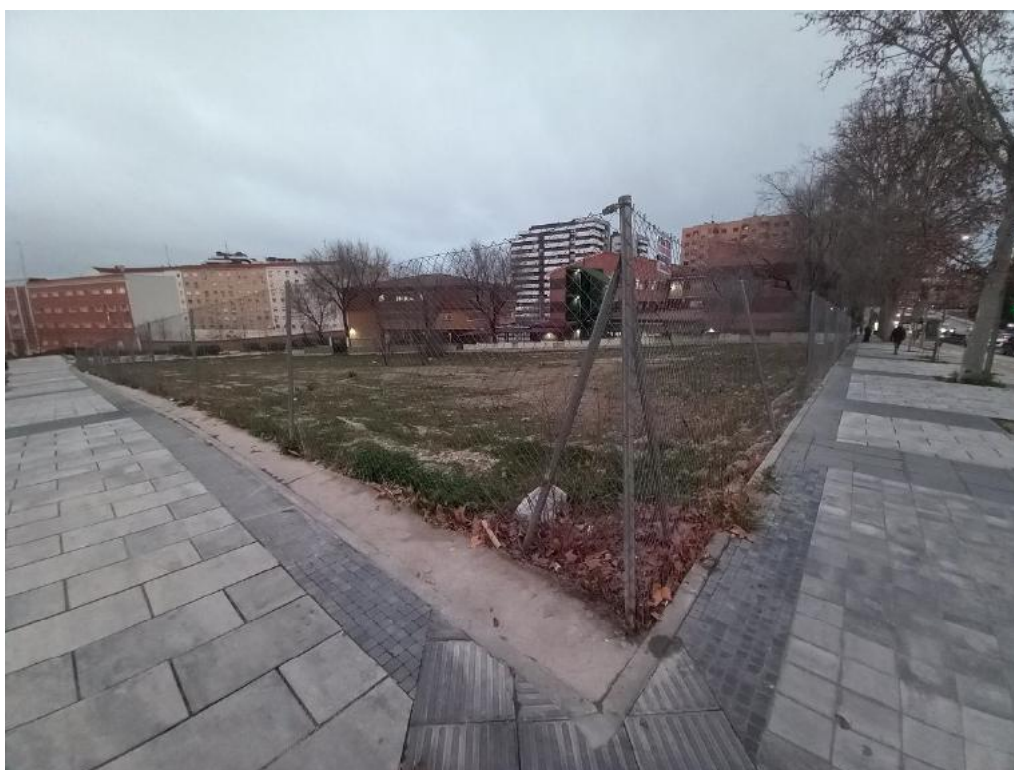
Esquina norte de la Calle Alejandro Dumas 17