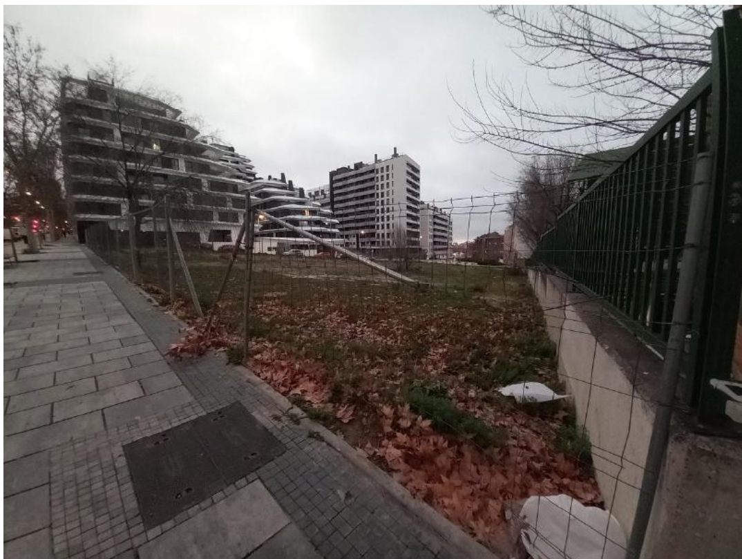
Vista desde Paseo de Pontones